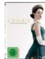
The Crown: Staffel 1 bis 3