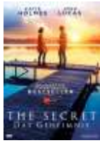
The Secret = das Geheimnis